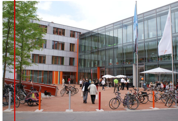
Neue Stadtbücherei Augsburg

oder per Fax 0821 450422-15 an das Freiwilligen-Zentrum Augsburg