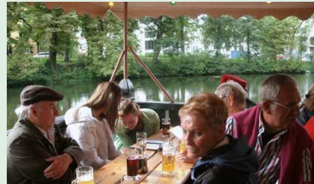
Links: Bild vom Sommerreffen der Ehrenamtlichen in der Kahnfahrt