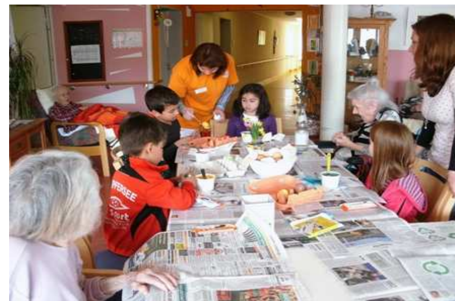
Gemeinsames Färben und Bemalen der Ostereier mit den Bewohnern des Christian-Dierig-Hauses und Kindern der AWO Kita West