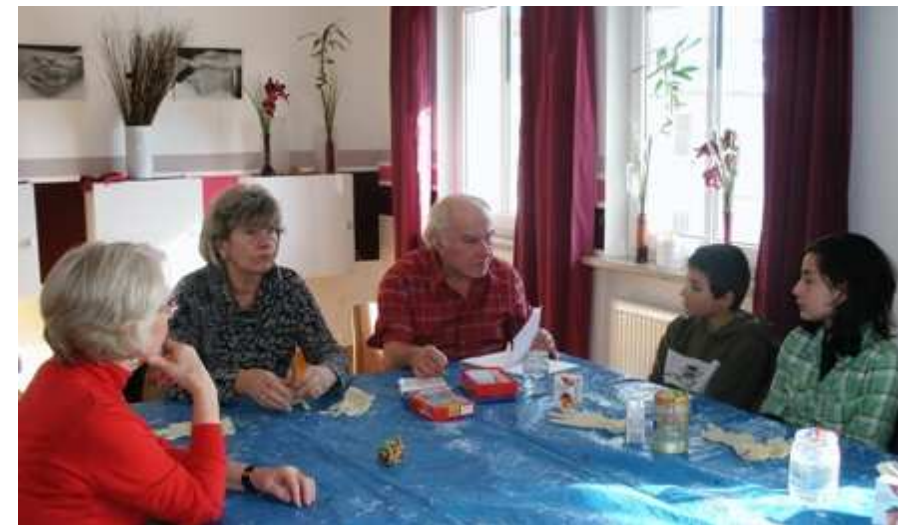
• Malnachmittag mit den Malern der Friedenshäuschen

Fühlen Sie sich ruhig angesprochen – jeder kann jederzeit dabei sein, sowohl als Teilnehmer, als auch als ehrenamtlicher Mitarbeiter. Wir freuen uns über jeden Teilnehmer und Besucher!