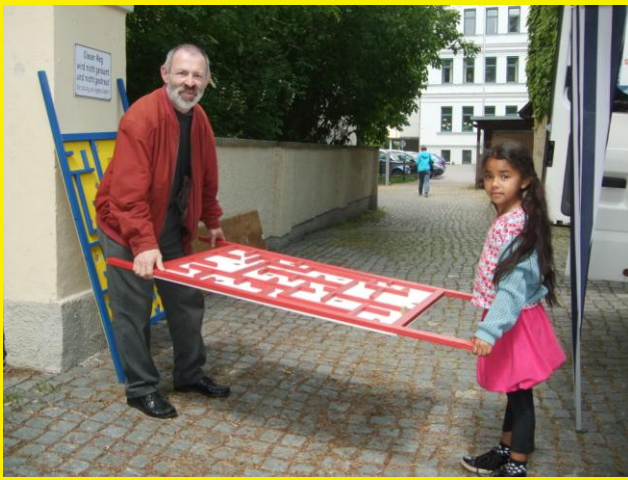
Am Tag der offenen Türe im Alten Gögginger Rathaus